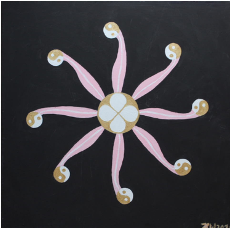
Bild Blume der Vergebung https://www.leben-in-wahrheit.de/spirituelle-kunst/

Der Rabatt ist erhältlich so lange die Meditation angeboten wird und zwar jedes Jahr vom 29.12. bis 31.12.