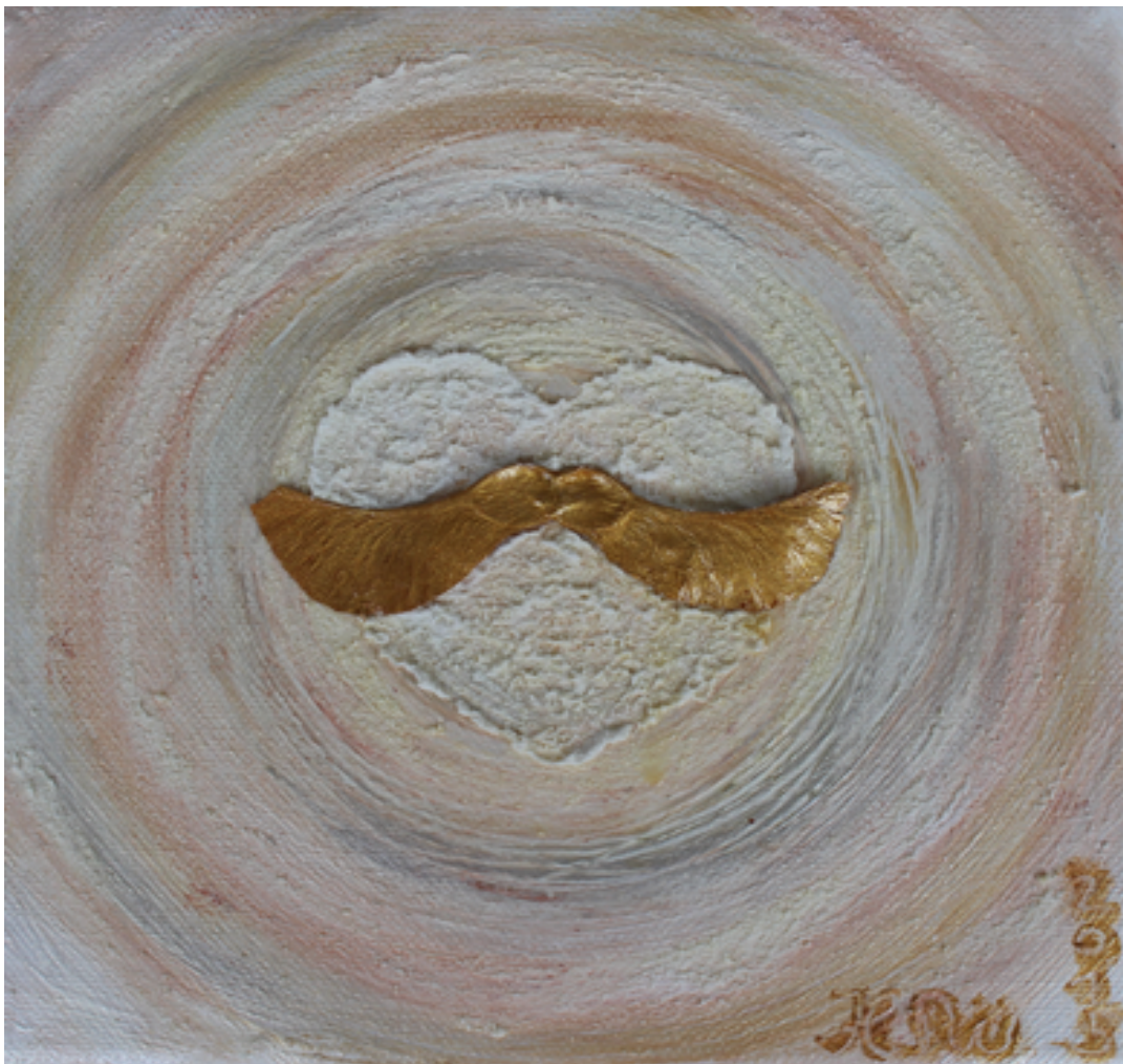
Bild Engel der Partnerschaft https://www.leben-in-wahrheit.de/spirituelle-kunst/

https://1drv.ms/u/s!ArLtgcSB84FvxniytOZU1-jJ5Hto?e=MfENlu