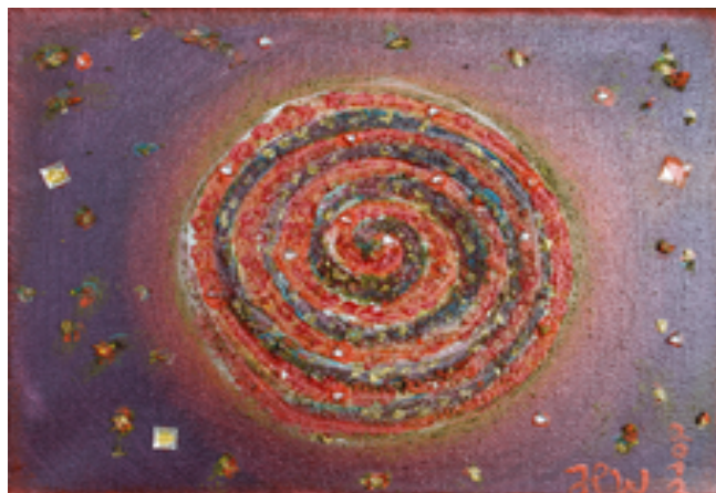
Bild Universe https://www.leben-in-wahrheit.de/spirituelle-kunst/

Gib folgenden Rabatt Code bei der Buchung an und erhalte 50% Rabatt auf die Mediation als Download: Rauhnächte Onlinekurs 50% Rabatt auf die Schweinehundmeditation. Der Rabatt ist erhältlich so lange die Meditation angeboten wird und zwar jedes Jahr vom 30.12. bis 02.01.