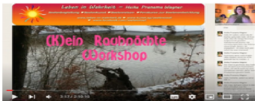
Rauhnächte-Video - Vollständige Version

Dies hier ist ein Video vom „(K)ein Rauhnächte Workshop“ den ich damals auf Sofengo gegeben habe. Leider ist die Qualität total beschissen und es ist anstrengend zu hören. JA ist so, das kann ich nicht mehr ändern, deswegen biete ich darüber auch nichts mehr an. Ich geb dir hier trotzdem den Link, du kannst dann selbst entscheiden, ob du dir das antun willst ;-) Hier: https://youtu.be/VX0MfQ8T6N8