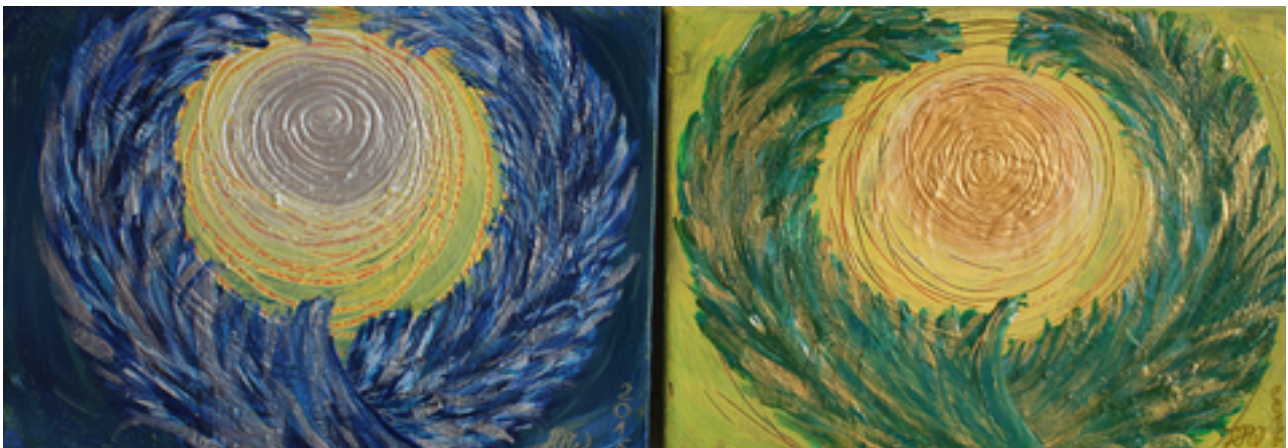
Bild Erzengel Michael und Raphael https://www.leben-in-wahrheit.de/spirituelle-kunst/

Der Rabatt ist erhältlich so lange die Meditation angeboten wird und zwar jedes Jahr vom 31.12. bis 03.01.