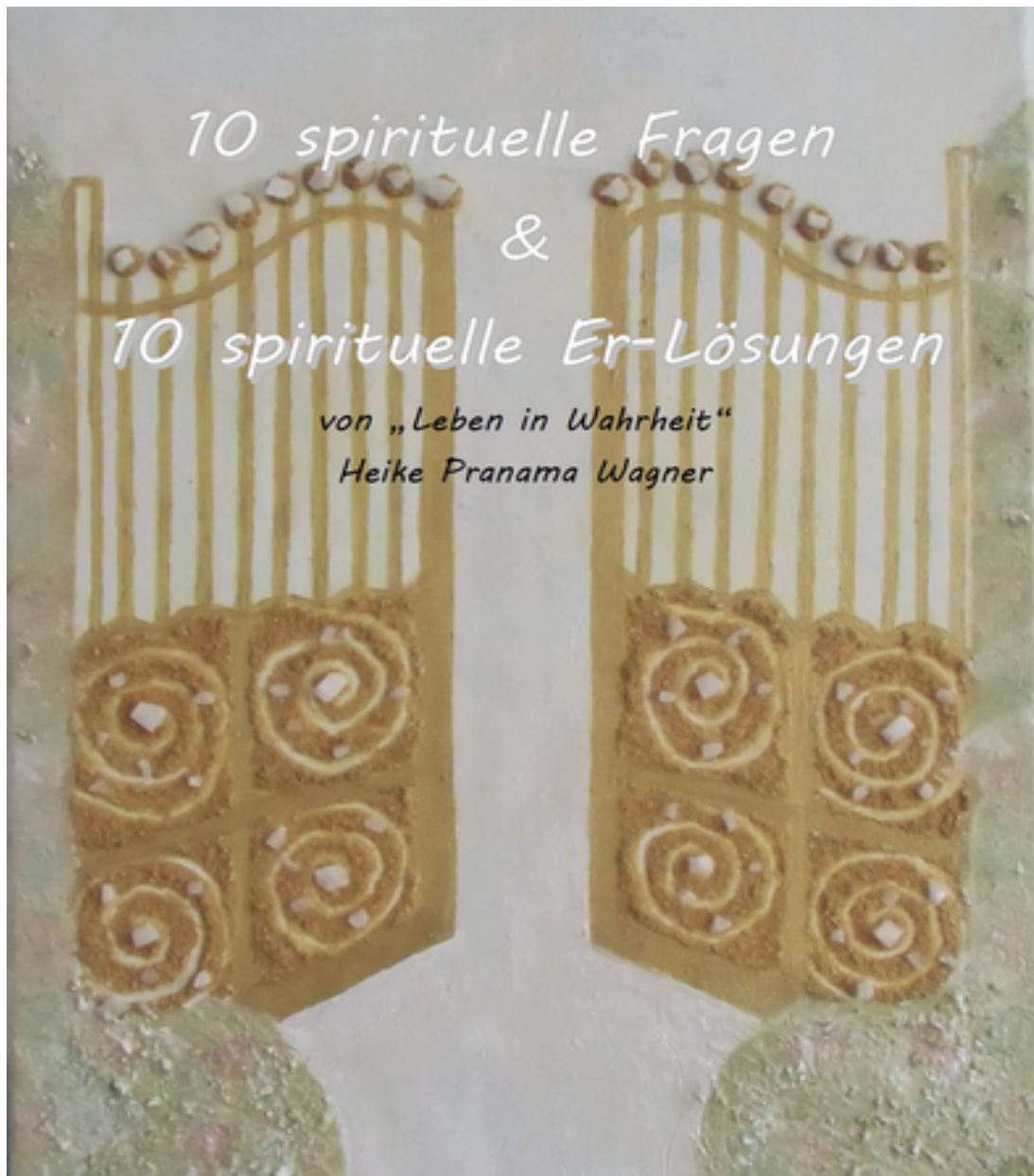
Bild das goldene Tor. https://www.leben-in-wahrheit.de/spirituelle-kunst/

Was sind spirituelle Fragen? Die Video-Frage Die „wer bin ich?“ Frage. Die Sinnfrage: Warum bin ich hier? Die Ziel Frage: Gibt es ein endgültiges Ziel? Die Bestimmungs-Frage: Was ist meine Mission? Die Frage der Wahl: Wenn es einen Lebensplan gibt, habe ich dann eine Wahl? Die Aufstiegsfrage: Was bedeutet Aufstieg wirklich & gibt es Aufstiegssymptome? Die Drama-Frage: Wie kann ich aus dem emotionalen Auf und Ab aussteigen? Die Frage der Heilung: Wie kann ich HEILER sein? Die letzte Frage: Was bleibt, wenn nichts mehr bleibt?